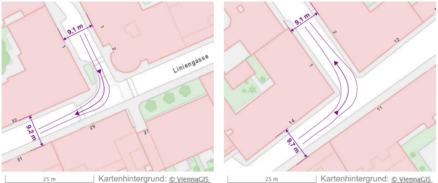
Abbildung 2: Schleppkurven (inkl. überstrichene Flächen der Überhänge) eines 18 m langen und 1,85 m breiten Mini-Doppelgelenkbusses am Beispiel der Kreuzungen Bürgerspitalgasse / Liniengasse (links) bzw. Liniengasse / Haydngasse (rechts) in Wien-Mariahilf. Die Schleppkurven wurden durch maßstäbliche Verkleinerung der Schleppkurven eines 24,7 m langen und 2,55 m breiten Doppelgelenkbusses ermittelt.

Zur Beurteilung der Kurvengängigkeit wurde ein Schleppkurvenskizze des Kantons Luzern für einen 24,7 m langen Doppelgelenk-Trolleybus 2 herangezogen, offenbar auch für eine Hess Lightram 25 DC oder ein geometrisch praktisch identes Fahrzeug. Die Schleppkurve wurde ebenso mit dem Faktor 72,8% verkleinert und zur Veranschaulichung über zwei beispielhafte Stadtplanausschnitte aus Wien gelegt: